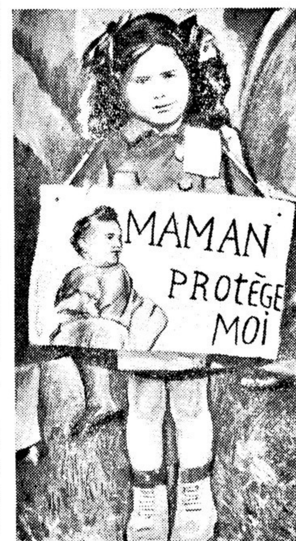
Маленькая участница демонстрации мира на парижском стадионе Буффало. Девочка несет плакат с призывом: «Мама, защити меня!»