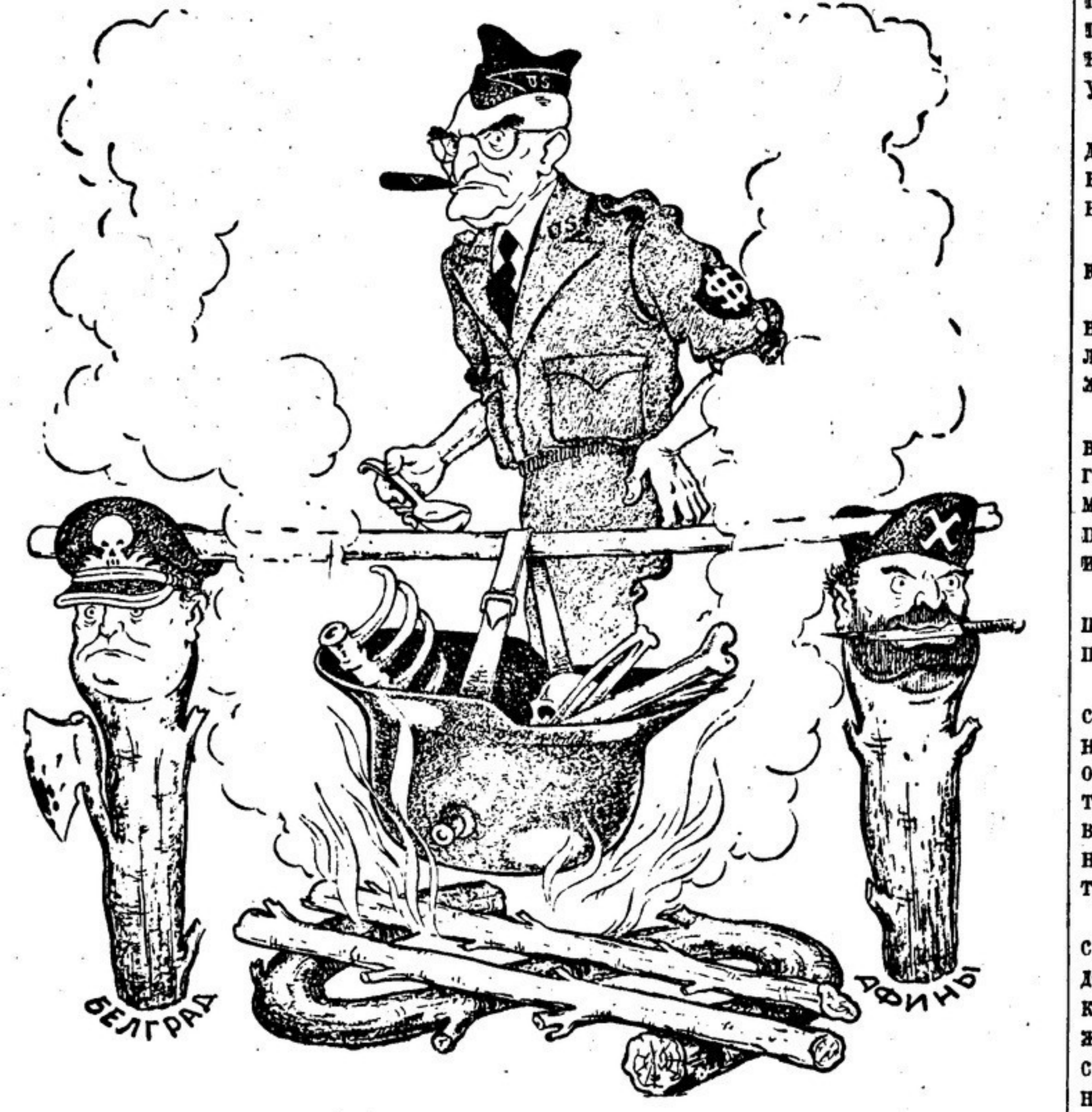
У БАЛКАНСКОГО ОЧАГА