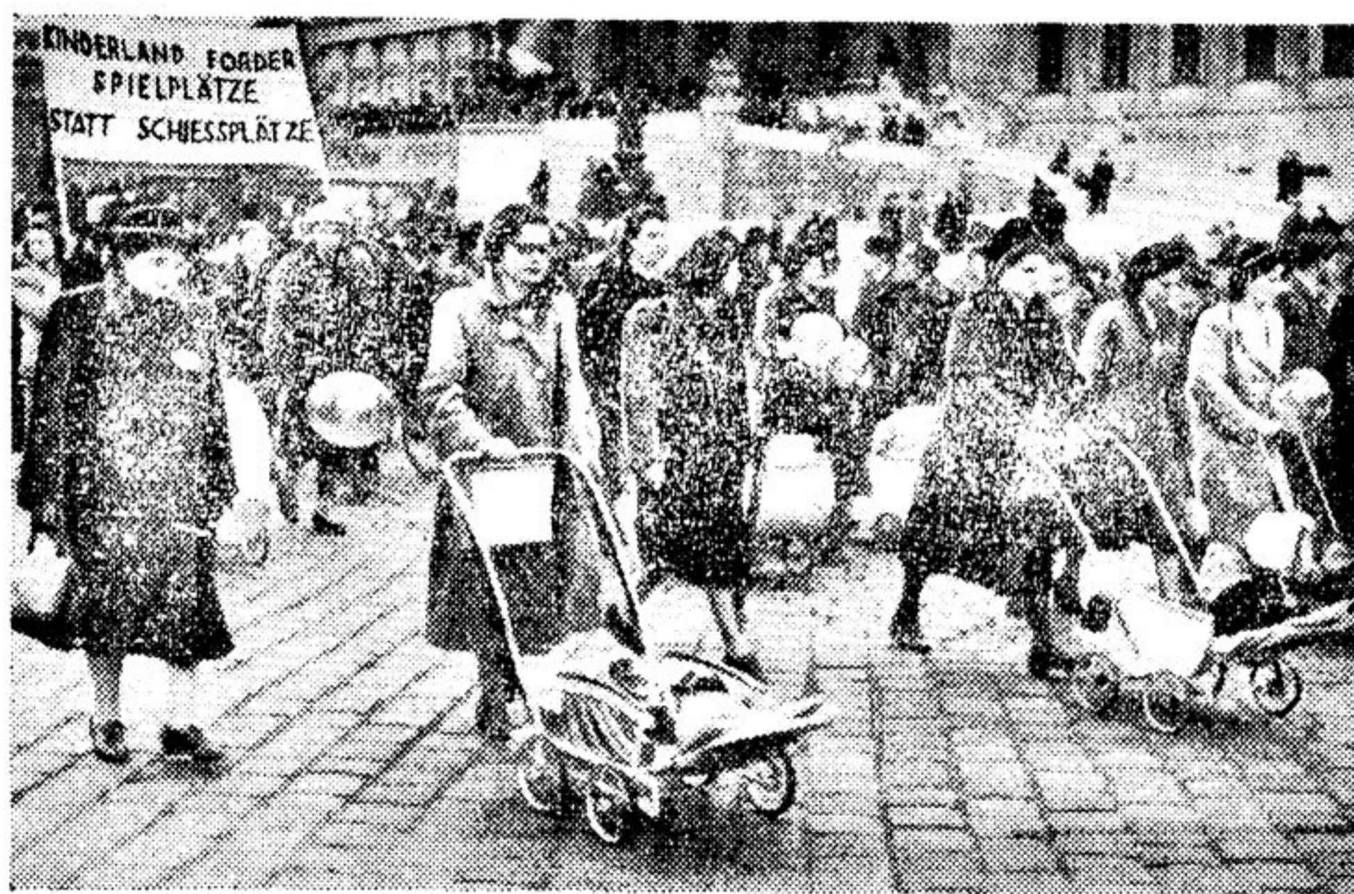
Союз демократических женщин Австрии организовал недавно в Вене мощную демонстрацию в защиту мира. Демонстранты несут плакат с надписью: «Детям нужны площадки для игр, а не полигоны».

Мальчики и девочки всех стран, необходимо бороться за мир! Наше будущее станет светлым и счастливым лишь тогда, когда эхо всех колоколов возвестит: «Мир, мир во всем мире!».